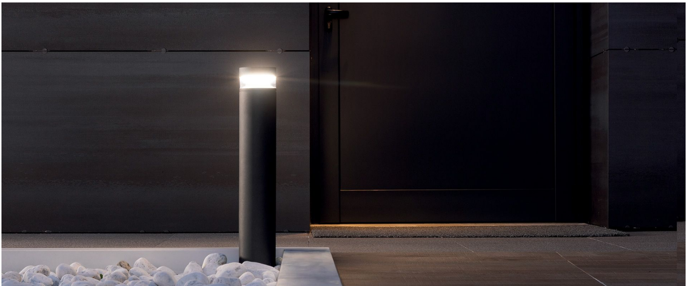
Immagine di montaggio: