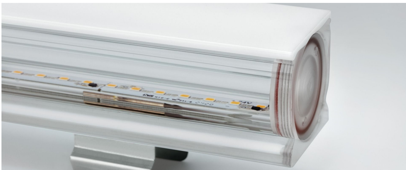
Immagine di montaggio: