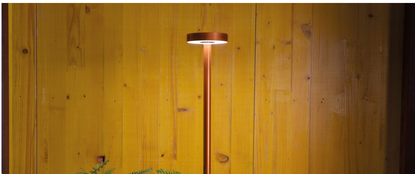
Immagine di montaggio: