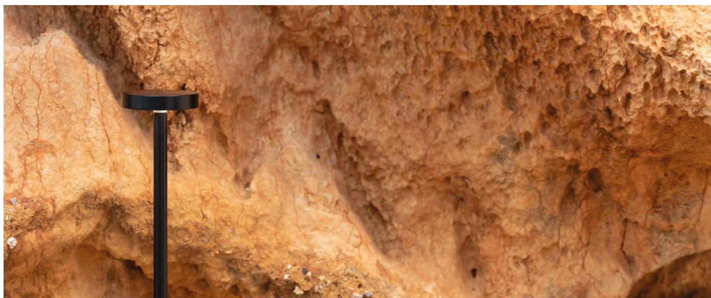
Immagine di montaggio: