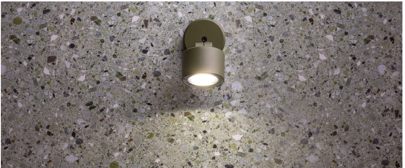
Immagine di montaggio: