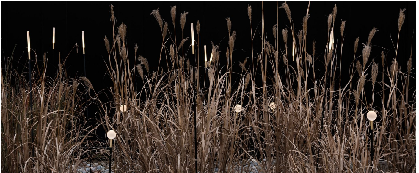
Immagine di montaggio: