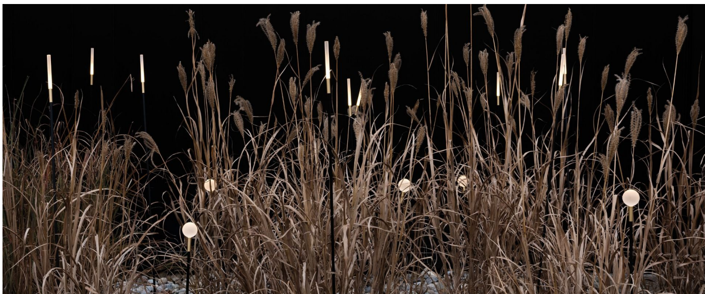
Immagine di montaggio: