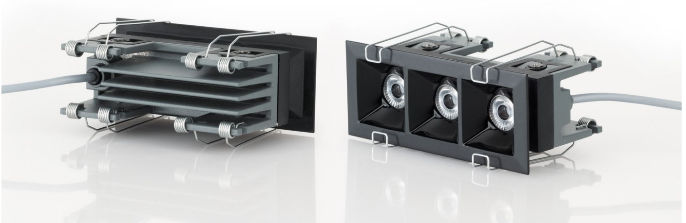
Immagine di montaggio: