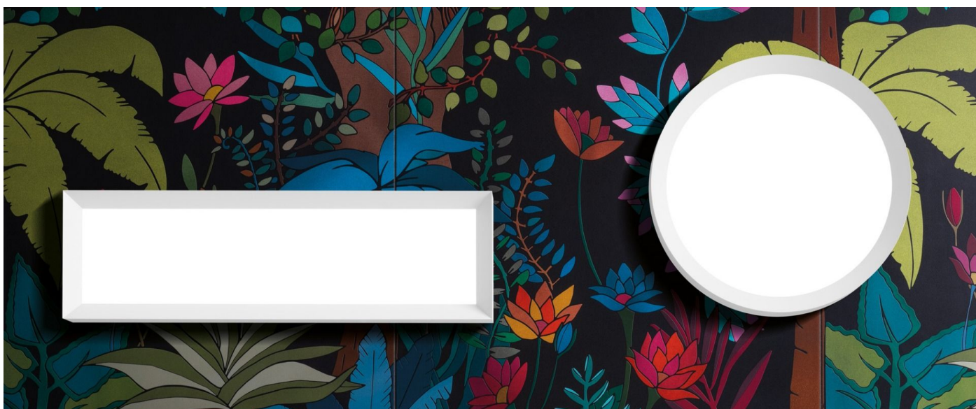
Immagine di montaggio: