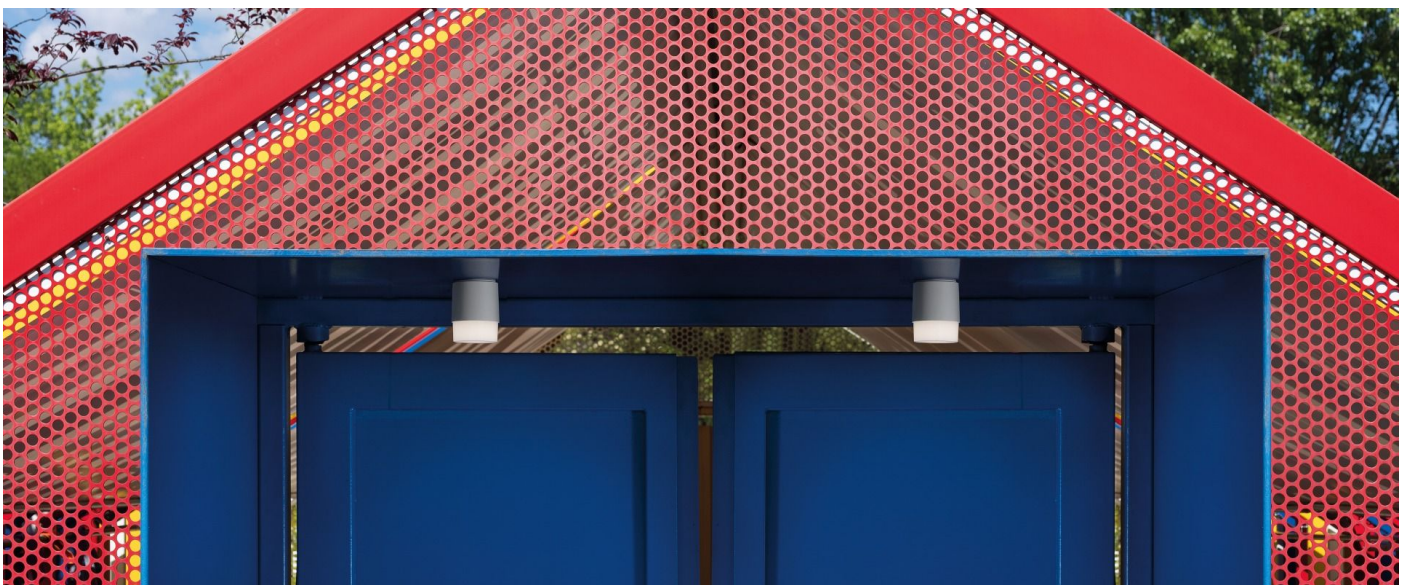
Immagine di montaggio: