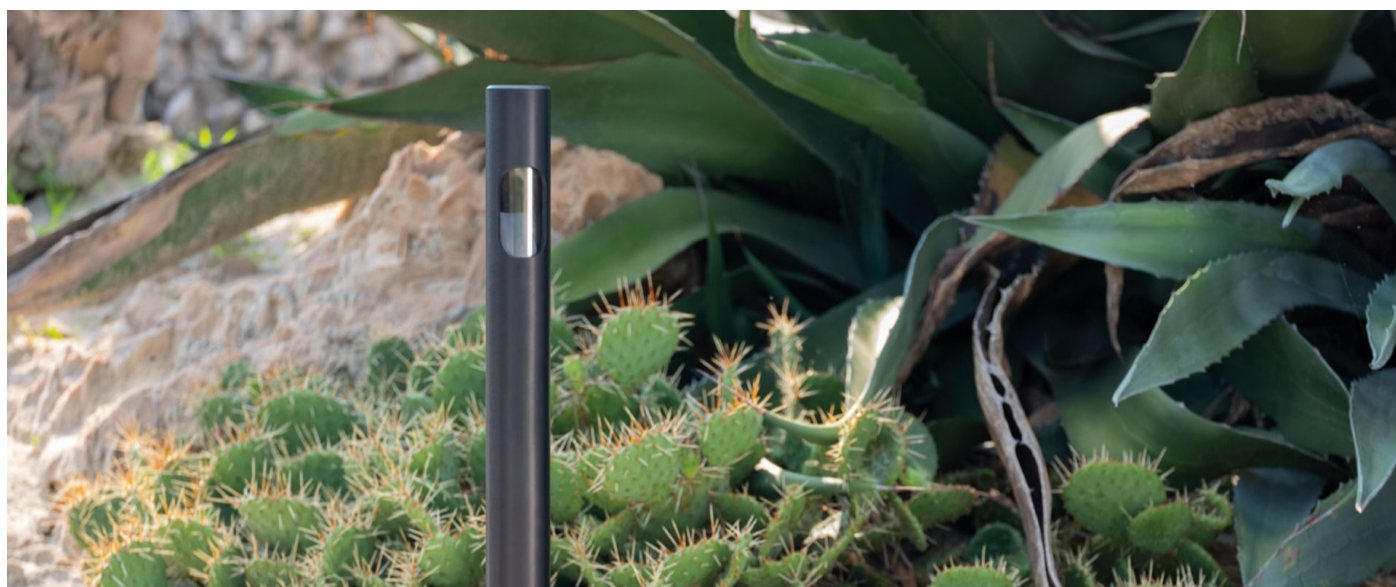
Immagine di montaggio: