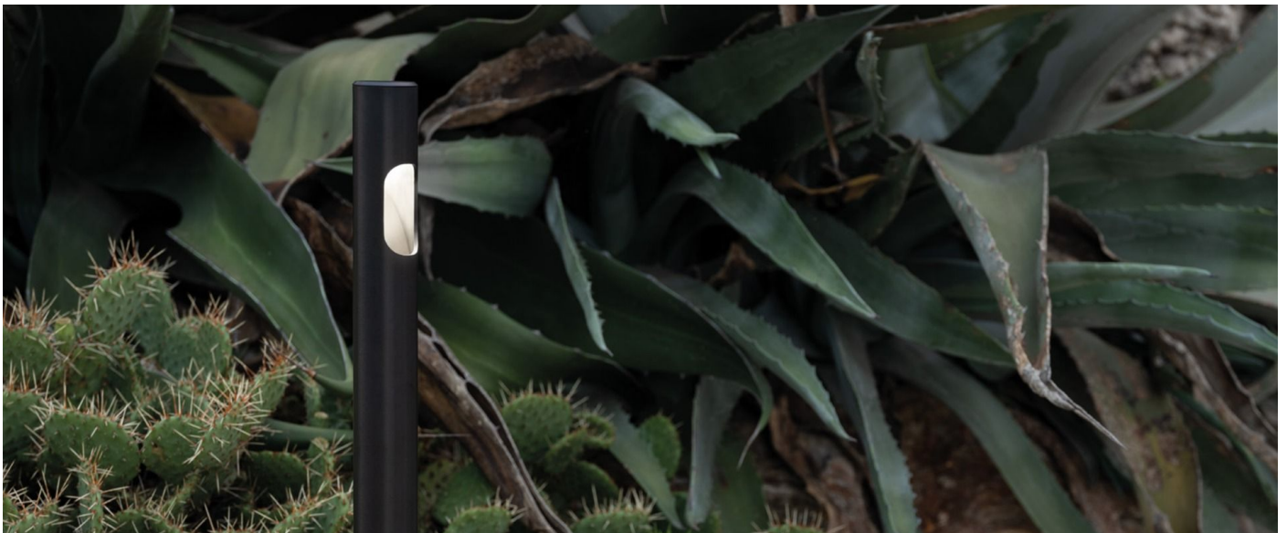
Immagine di montaggio: