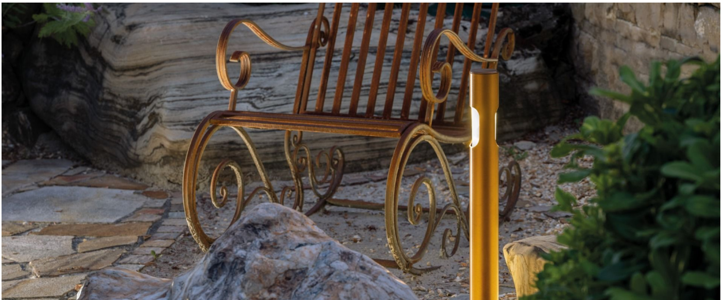
Immagine di montaggio: