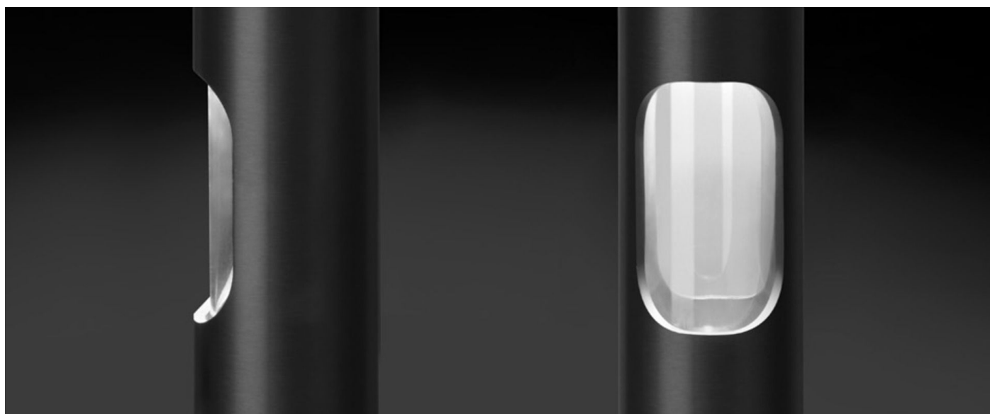
Immagine di montaggio: