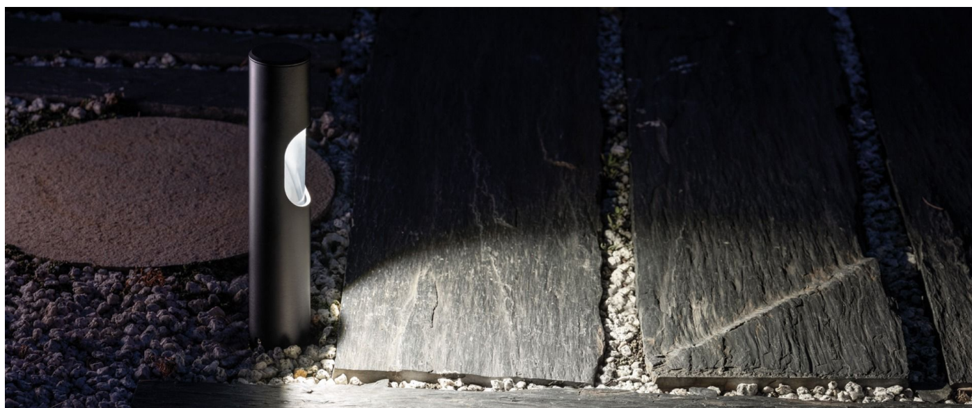
Immagine di montaggio: